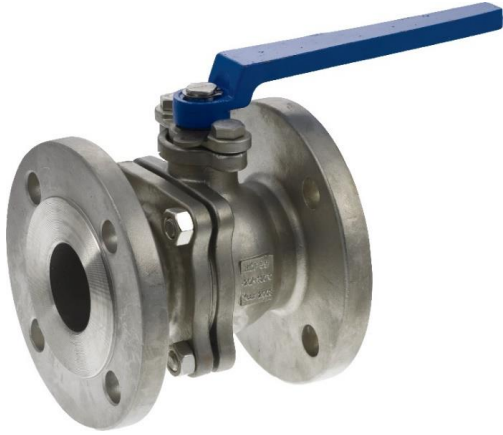
pipe handle system DN 125 - DN 150 pijp hendel systeem DN 125 - DN 150