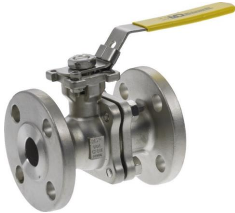
NPS 1/2" - NPS 2.1/2"